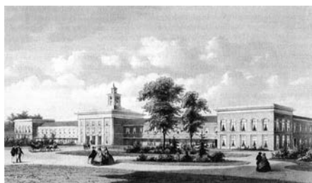
3 Hoofdgebouw PZ ca 1865.

De Provincie heeft in 1843 het voornemen de hofstede "Meer en Berg" in Bloemendaal te kopen met als doel er een psychiatrisch ziekenhuis van te maken. Om tegenstanders van het toekomstige ziekenhuis de wind uit de zeilen te nemen en grondspeculatie tegen te gaan, besluit Jhr. Jan Pieter Teding van Berkhout, van de Staten van Holland, om de hofstede op zijn naam aan te kopen. De familie doet immers regelmatig grondaankopen in de regio. Al na vier dagen wordt "Meer en Berg" doorverkocht aan de Provincie.