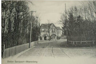
12 Vervolgt de baan over de weg.