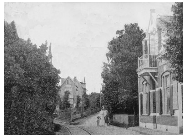
11 Deze komt bij het Postkantoor het bos uit.