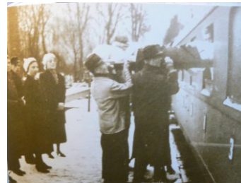
15 Evacués worden in de trein geholpen.

Na de oorlog bleek dat de infrastructuur van het ziekenhuis om een andere vorm van inrichting vroeg. Op de plaats van de kolenopslag kwamen werkplaatsen voor arbeidstherapie. De verwarming werd aangepast voor het gebruik van gas. En belangrijk verandering was dat het meeste transport nu per auto ging en niet meer per spoor of smalspoor.