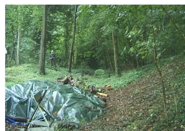
17 De geul van het spoor is nog zichtbaar in achtertuinen.