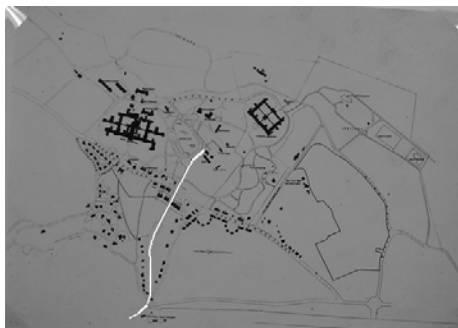
5 Kaart PZ ca 1915 met de trein tracé door het bos.

In 1890 kwam een verbinding met het Provinciaal Ziekenhuis tot stand, met op het nieuwe station, een eigen wachtkamer voor patiënten van de instelling. Ook station Haarlem beschikte over een zo'n speciale wachtkamer.