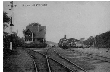
13 Gaat de afbuiging naar het rangeerspoor op.

In het oorlogsjaar 1943, werden via dit spoor de patiënten, op last van de bezetters, geëvacueerd. Twee 'echte' stoomlocomotieven reden op deze baan. De evacués werden o.a. ondergebracht in de ziekenhuizen in Den Dolder en Vught.