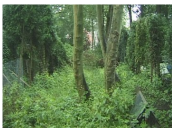
16 Tussen de bomen zichtbaar het voormalig postkantoor.

Het tracé van de baan is in het Sleutelbos, anno 2010, nog steeds zichtbaar in de achtertuinen van de bewoners van de Duinweg of Duivelslaan (onevenzijde).