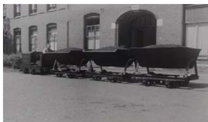
6 Het smalspoortreintje achter Meerenberg I.

Op het Ziekenhuisterrein zelf was een smalspoor verbinding aangelegd om de goederen te distribueren naar de gebouwen voor het ziekenhuis. Deze liep van het overslagpunt bij de ingang naar de achterzijde van Meerenberg I en vandaar langs de rand van het terrein, naar Meerenberg II.