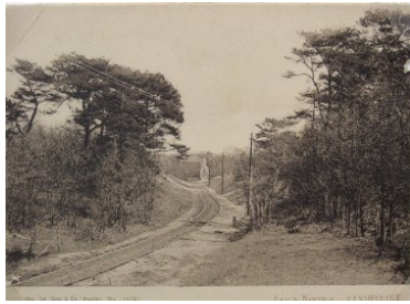
10 De route door het Sleutelbos.