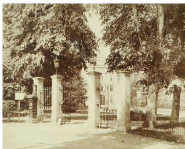
2 Ingang Provinciaal Ziekenhuis aan de Brederodeweg.

Met deze wet, die op 29 mei 1841 wordt aangenomen, krijgen de Provincies de verantwoordelijkheid voor het scheppen van plaatsruimte in geneeskundige gestichten, zoals Meerenberg later zal worden. Deze gestichten hadden het genezen van krankzinnige tot doel.