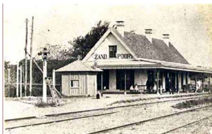
4 Station Zandpoort 1867.

Op 1 mei 1867 werd door de Hollandsche Spoorweg Maatschappij de spoorbaan en het station 'Zandpoort' op het traject Haarlem - Alkmaar geopend.