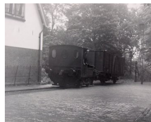
7-9 De Montania steekt de Brederodeweg over en gaat via de Evertslaan tussen de huizen van de Schroeder van der Kolkweg door het bos in richting het station Santpoort-Zuid.

Tijdens de bouw van de huizen aan de Schroeder van der Kolkweg in 1913, werd er ruimte vrij gehouden voor de daar aanwezige spoorbaan van het Provinciaal Ziekenhuis