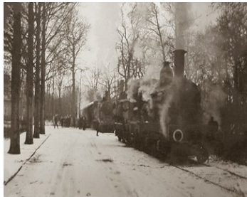
14 De twee stoomlocomotieven op de baan tijdens de evacuatie in 1943.

In het oorlogsjaar 1943, werden via dit spoor de patiënten, op last van de bezetters, geëvacueerd. Twee 'echte' stoomlocomotieven reden op deze baan. De evacués werden o.a. ondergebracht in de ziekenhuizen in Den Dolder en Vught.