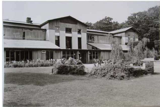
Paviljoen 1860 na verbouwing 1974

Een vermeldenswaardig complex, is de eigenlijke eerste uitbreiding buiten het gebouw, dan genoemd het "Paviljoen" in 1860 in hier plaats voor ca. 90 bewoners met meer lichamelijke kwalen en een aantal met epilepsie. Voor dit gebouw verreizen 2 kleine complexen in de zelfde stijl n.b. anatomie en klein zusterhuis. Aan de noord achterzijde van het hoofdgebouw hebben jaarlijks kleine en grote aanpassingen plaats, al naar gelang de bevolking of bewoning dit verlangd. De eerste gashouders komen daar, naast het gebouw, warmte en stoken is dan nog een groot probleem. Aan de zuidzijde komt er een behoorlijk grote wasserij toegerust voor het aantal groeiende bewoners, het vuilwaterprobleem en de fecaliën afvoer vormt een groot obstakel en is menig maal twistpunt met omwonenden. Het anatomie gebouw al meer dan 135 jaar oud is nog bijna in de originele staat. Het is gebouwd nadat er obducties werden gedaan in een studie ruimte van het hoofdgebouw, voor onderzoek in de ( hersen)anatomie en laatste bezoekplaats voor familie. Het is altijd als onderzoek ruimte ingericht geweest en in latere tijden aangepast aan nieuwere inzichten tot ca. 1985. Daarna heeft het een plaats gekregen binnen de opleiding van verpleegkundigen, waarvan het centrum tot dan vanaf 1892 in het zusterhuis en later Paviljoen/ POC was gehuisvest.