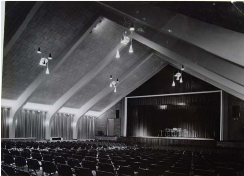
Musis Sacrum direct na de bouw in 1959/ 60

Pas in 1959 na 90 jaar heeft men besloten voor Musis Sacrum een nieuwe ruimte te bouwen en wel bijna recht tegenover de ingangslope. Deze zaal met alle schouwburg en bioscoop faciliteiten voor ca. 500 personen, kon alle vergelijkingen met zalen uit middelgrote steden met glans doorstaan. Wekelijks en soms met grotere frequentie waren er films of voorstellingen. Overdag in gebruik als ontmoetingsruimte en verkoop van therapie goederen en lekkernijen en als bezoekers centrum. Gedurende een aantal jaren heeft de zaal als uitwijkplaats dienst gedaan, wanneer het weer te slecht was om in het Bloemendaals openlucht theater te spelen. Musis Sacrum heeft maar ca. 35 jaar dienst gedaan en is na een geweldvolle kraakactie volledig door brand verwoest.