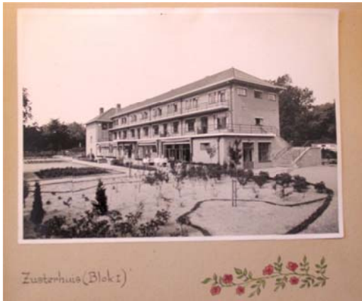
Zusterhuis blok 1 1937